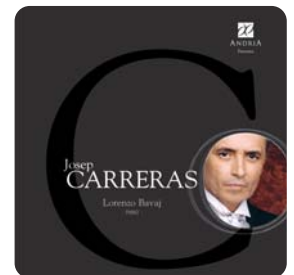
Programa de mano. Josep Carreras. Teatro Juan Bravo