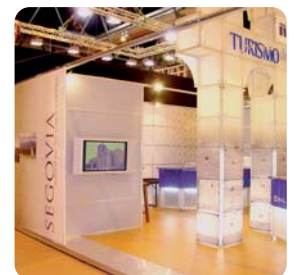
Stand Fitur 2006-2007 Turismo de Segovia