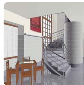
Proyecto Interiorismo. Café Juan Bravo