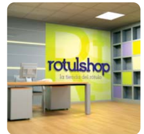
Proyecto Interiorismo. Rotulshop