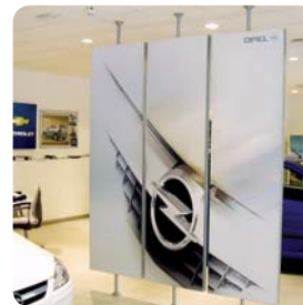
Paneles 360°. Opel