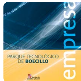
Guía Empresas. Parques Tecnológicos de Castilla y León