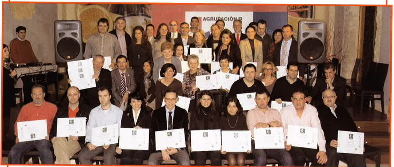
Comerciantes certificados en 2010, en Calidad de Atención en el Pequeño Comercio - Norma UNE 175001.